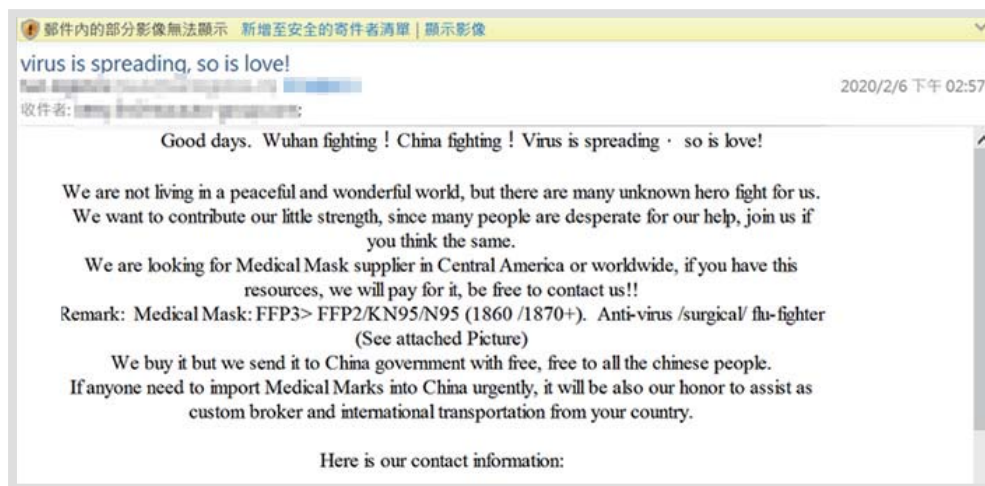
募集捐款购买防疫物资的诈骗邮件

数量最多的是诈骗邮件, 大部分是假冒研究机构或医疗单位, 请求收件人捐钱; 也有诈骗邮件谎称可购买疫苗或检测试剂, 也是以骗财为目的。